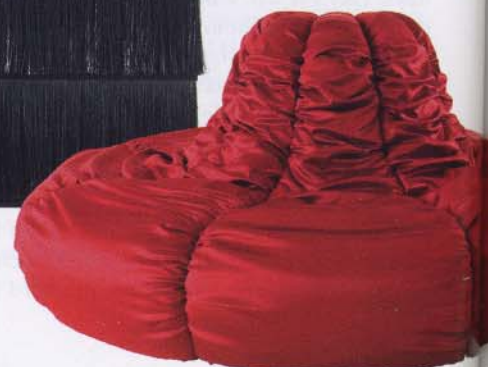
Soffa/bänk Chantilly, från Edra.