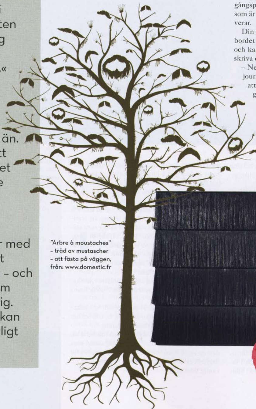
"Arbre à moustaches" – träd av mustascher – att fästa på väggen, från: www.domestic.fr

Inga Sempé föddes 1968 och växte upp i en konstnärlig familj. Intresset för föremål har följt henne sedan barnsben då mamman tog henne med till olika museer (vilket hon ha-